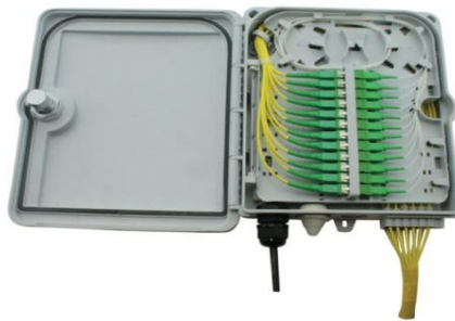
Ouvert sur raccords